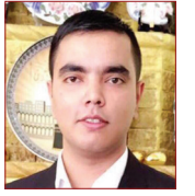
عمەدوللا شاخوان تۆژەری یاریده‌ده‌ر

وشه‌یه‌کی لاتینییه، به واتای رازینه‌بوون دیت له‌سه‌ر شتیگ، له‌کاتی رازینه‌بوون له‌سه‌ر هه‌ر بپاریژی پێشکه‌شکراو هه‌ج جۆره‌ روونکردنه‌وه‌یه‌ک نادریت له‌سه‌ر هۆکاره‌کانی رازی نه‌بوون و ره‌تکردنه‌وه‌ی بپارێکه‌ و مافی قیتو له‌ به‌لگه‌نامه‌ی نه‌توه‌ یه‌گرتوه‌کاندا ئاماره‌ی پێ-کراره. ئەندامانی هه‌میشه‌یی نه‌نجومه‌نی ئاسایش پێکهاتوون له‌ ولاتانی (چین، فهره‌نسا، به‌رتانیا، روسیا، ویلايه‌ته‌ یه‌گرتوه‌کانی نه‌مه‌ریکا) و رازی نه‌بوونی یه‌کێک له‌م ده‌وله‌تانه‌ به‌سه‌ یۆ شه‌وه‌ی ئه‌و بپارێه‌ پێشکه‌ش کراره‌ به‌ شه‌وه‌یه‌کی کۆتایی هه‌لبه‌شینه‌وه‌، هه‌تا ئه‌گه‌ر هاتوو 14 ئه‌ندامه‌کی تریش له‌سه‌ر بپارێکه‌ رازی بوون، ئه‌وا ئه‌م رازیبوونه هه‌ج کاریه‌رییه‌کی نابێ له‌سه‌ر بپارێه‌ یه‌لوه‌شاندنه‌وه‌، هۆکاری گه‌رانه‌وه‌ی ئه‌م ده‌وله‌تانه‌ یۆ به‌کارهینانی قیتو یۆ پاراستنی به‌رژه‌وه‌ندییه‌کانه‌، یان یۆ پاراستنی به‌رژه‌وه‌ندیی ولاتیکه‌ که‌ یه‌کێک له‌و ئه‌ندامانه‌ی مافی قیتوکه‌ به‌کار ده‌هێنن، به‌ هه‌ویشه‌ی سه‌ره‌کی خۆی دانه‌ن و ده‌یویت به‌رژه‌وه‌ندییه‌کانی بپارێزن، به‌لام له‌ کاتی به‌کارهینانیدا هه‌ج ریگیه‌یک یۆ جێبه‌جێکردنی