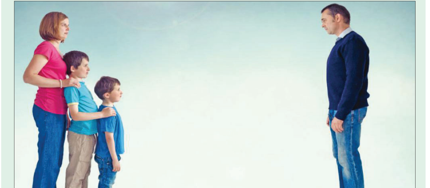
هه‌ره‌سه‌هینانی خیزان و دیارده‌ی جیابوونه‌وه‌، به‌ کێشه‌یه‌کی کۆمه‌لایه‌تی و په‌تایه‌کی ترسناک داده‌نریت له‌ناو کۆمه‌لگادا، نه‌خاسه‌ ئه‌و کۆمه‌لگانه‌ی

ساده‌ی و ناویزان به‌ یه‌کتەر، یاره‌متی دروستکردن و پێکه‌ینانی خیزان و کۆمه‌لگا ده‌دات. دروستیوونی بۆشایی سۆز و خۆشه‌ویستی له‌ناو ژيانی هاوسهرانی تازه‌ پێکه‌یشتوودا، به‌هۆی راگه‌باندنه‌کان و کتێب و گۆفاره‌کانه‌وه‌ جوان کراره‌ و رازیناره‌ته‌وه‌ نه‌ک گرینگی به‌لکو لاوان هان ده‌دات بۆی، ئایه‌ ئه‌مه‌ په‌تایه‌ بۆ خۆشه‌ویستی؟ له‌و نووسینه‌دا ده‌ست ده‌خه‌مه‌ سه‌ر برینه‌کانی هاوسهران و ئه‌وانه‌ش که‌ ده‌یانوه‌یت ژيانی هاوسهری پێک به‌هێنن و ئاگه‌داریان بکه‌مه‌وه‌ له‌ هۆکارانه‌. چرکه‌یه‌ک بۆ هه‌موو ئن و میژدیکه‌،